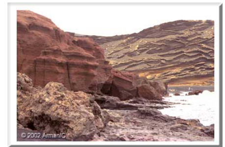
El Golfo, krater