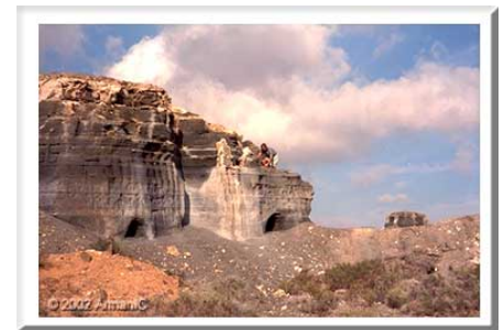
Geërodeerd landschap bij Guatiza