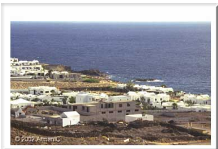
Charco del Palo, overzicht