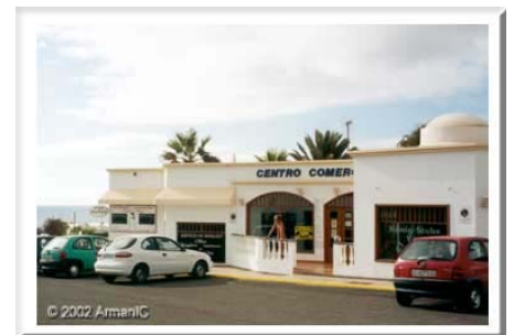
Charco del Palo, winkels