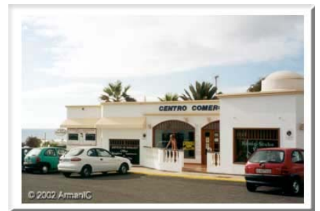
Charco del Palo, winkels